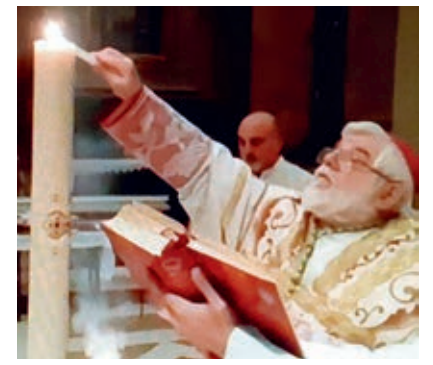
appare molto buio. «Fidiamoci del Signore e non ce ne pentiremo», ha concluso padre Giovanni.

cappella dell'episcopo. Per il triduo pasquale si è spostato in cattedrale, dove ha celebrato in una forma un po' più solenne, rigorosamente a porte chiuse. Nell'omelia delle Messa di Pasqua ha paragonato la nostra attuale situazione a quella di tristezza e delusione dei due discepoli di Emmaus; anche a noi il Risorto ripete: «Stolti e tardi di cuore nel credere tutto ciò di cui hanno parlato i profeti...». Bisogna alzare lo sguardo dal maestro morto e vedere il Cristo risorto. In lui troviamo la forza per non scoraggiarci e guardare con fiducia a un futuro che umanamente