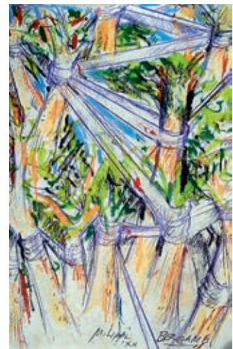
Massimo Lippi, particolare dell'installazione «Bergamo-Fratelli»

L'autore dedica questa poesia all'Italia, perché l'arte e la forza spirituale, che promanano dalla parola e dalla speranza, siano di conforto per riaffermare nel mondo la missione culturale del nostro Paese. Grato a Dio per l'opera professionale di tante persone di buona volontà che hanno dato la vita e di tanti sacerdoti che hanno testimoniato fino al sangue l'Amore di Dio.