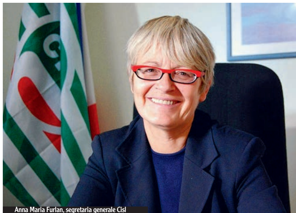
Anna Maria Furlan, segretaria generale Cisl