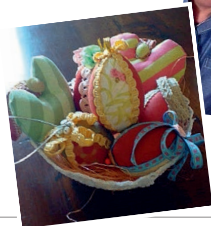
Creatività pasquale (Dina Cavicchi, Prato)