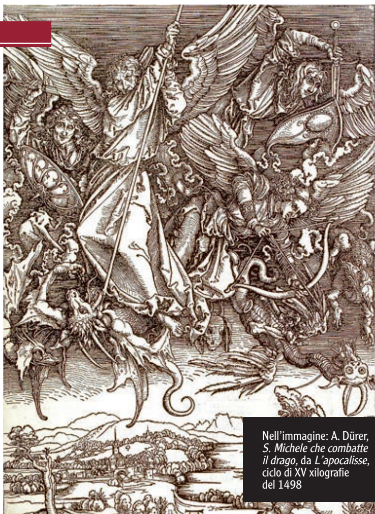
Nell'immagine: A. Dürer, S. Michele che combatte il drago, da L'apocalisse, ciclo di XV xilografie del 1498

Non finisce di sorprenderti, in effetti, la lucidità delle riflessioni che Dietrich Bonhoeffer ha affidato alle ormai famosissime lettere dal carcere, molte delle quali vere e proprie «lettere teologiche» indirizzate, appunto, al suo amico e interlocutore Bethge. Riaprirle in queste settimane di «reclusione», certo imparagonabili con il regime carcerario cui egli è stato sottoposto, ce le rende forse più vicine e vere. Perché, come noi, anche Bonhoeffer lotta incessantemente per tenere viva la speranza, quasi rimproverando il suo amico che non riesce a fare altrettanto: «Vedi, non lascio cadere la speranza. Fa' anche tu lo stesso» (p. 316). E si ingegna per non appiattire il tempo della sua detenzione dandogli un ordine e una regolarità che forse possono aiutare anche noi, posti improvvisamente davanti a ore, giorni e settimane a nostra disposizione in modo del tutto inedito. Ci sono rimaste le preghiere scritte per i suoi compagni di prigionia, una per il mattino, una per la sera e una per le situazioni di particolare bisogno. Così com'è lui stesso a raccontarci di aver dato un ritmo preciso alle sue giornate. Quella che più gli manca è la musica. Ed è proprio intorno alla Pasqua 1944 che registra questa assenza in modo esplicito: «Da un anno non ho più sentito cantare nemmeno un corale» (p. 345). Niente musica, niente liturgia: un altro elemento che rende la sua testimonianza tanto più vicina e stimolante. Niente musica, continua, «ma è