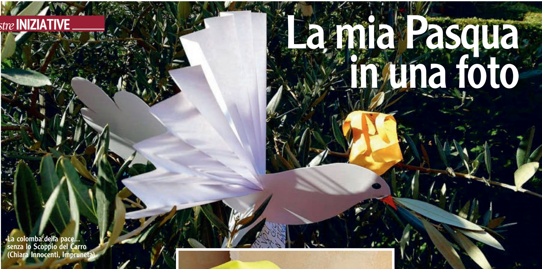
La colomba della pace... senza lo Scoppio del Carro (Chiara Innocenti, Impruneta)

Tanta voglia di vivere ugualmente la festa, con le restrizioni imposte per la pandemia. Tavole curate e contatti con i parenti via telefono o attraverso videochiamate